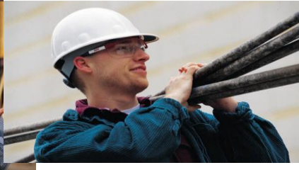
Formateur/-trice en entreprise